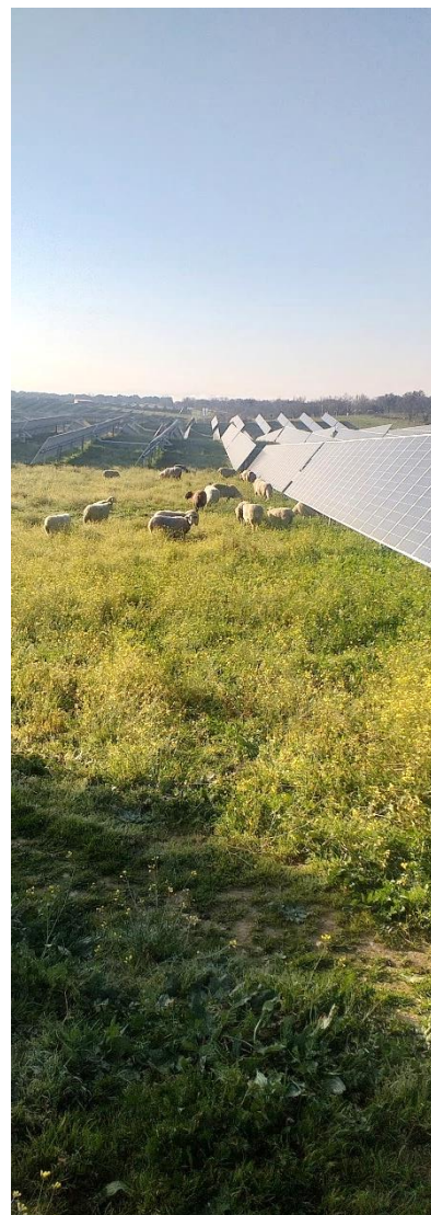
Planta solar El Baldío 1

La reducción de emisiones está por encima del objetivo establecido para final de 2021