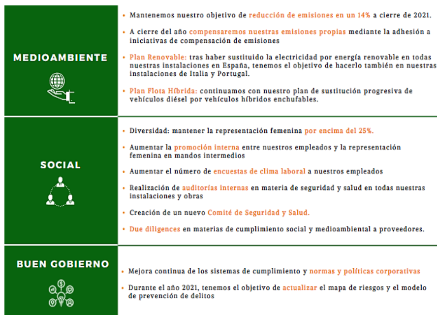
Objetivos ESG 2021

Durante el periodo hemos hecho públicos nuestros objetivos de 2021 en materia ESG en nuestra página web corporativa: www.solariaenergia.com . Como dato destacable, algunos de los objetivos marcados ya han sido cumplidos antes de finalizar el plazo establecido.