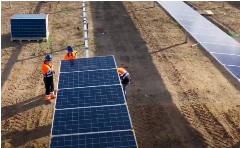
Planta solar El Baldío 1

Durante el periodo hemos aprobado la política de respeto de los derechos humanos, que se complementa con otras normas y políticas corporativas. También hemos realizado la evaluación de riesgos en materia de derechos humanos y nos hemos adherido al Pacto Mundial de las Naciones Unidas, a través de la Red Española, manifestando y reforzando nuestro firme compromiso con los Diez Principios universalmente aceptados en las áreas de derechos humanos, normas laborales, medioambiente y lucha contra la corrupción, así como con la adopción de medidas en apoyo de ODS y la Agenda 2030.