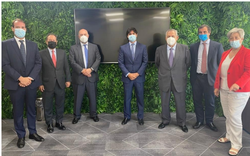
Consejo de Administración de Solaria.

Además, en Solaria sabemos que la gestión de riesgos y oportunidades es fundamental para una buena estrategia empresarial. Por ello, nos encontramos en proceso de actualizar nuestro mapa de riesgos, incluyendo riesgos medioambientales, riesgos de vulneración de los derechos humanos, etc.