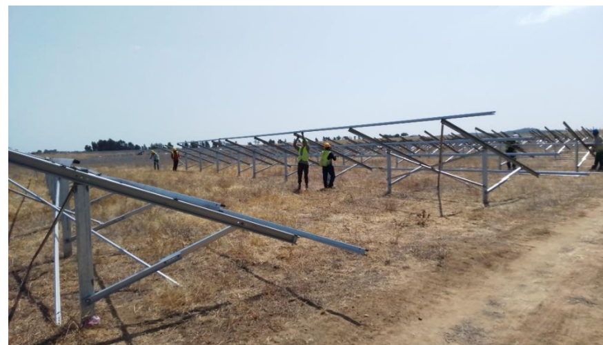
Planta solar Mendo Marco (Portugal) en construcción

En julio de este año hemos lanzado nuestra primera encuesta al 100% de nuestra plantilla.